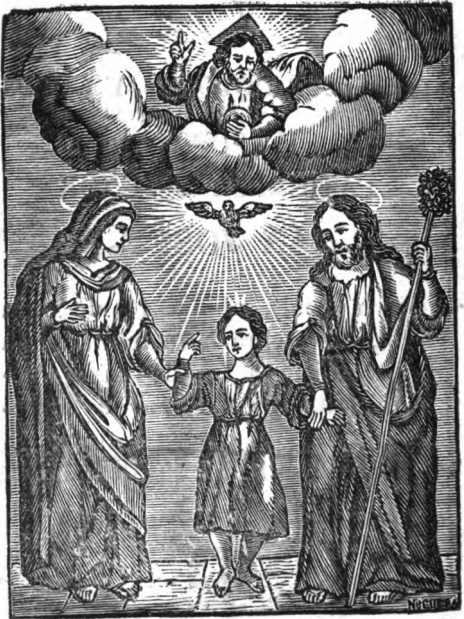
JESUS, MARIA Y JOSEF.